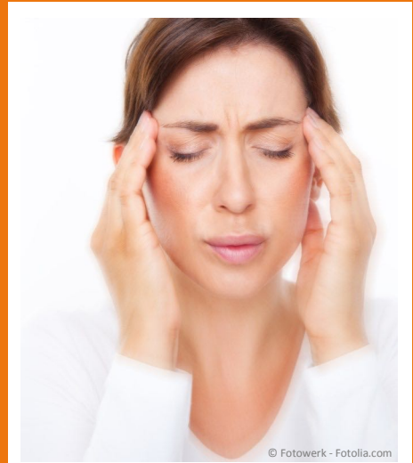
Schmerzen in der Kaumuskulatur und in den Kiefergelenken deuten auf nächtliches Zähneknirschen hin.

Etwa ein Drittel aller Menschen hat Kiefergelenksprobleme oder ernsthafte Zahnschäden, die vom Zähneknirschen oder Pressen kommen. Die Folgen äußern sich nicht nur im Mund (z.B. in Form kalteempfindlicher Zähne), sie können auch zu Kopfschmerzen, Ohrengeräuschen, Verspannungen der Nackenmuskulatur und zu Bandscheibenproblemen führen. Die Betroffenen wandern oft von Arzt zu Arzt, ohne dass ihnen wirklich geholfen wird. Dabei kann der Zahnarzt in vielen Fällen durch relativ einfache Maßnahmen die Beschwerden lindern.