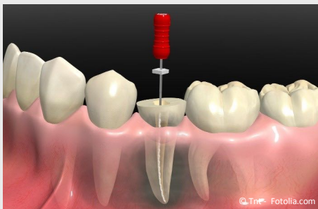
Wurzelbehandlung eines zerstörten Zahnes

Wurzelbehandlungen werden meistens mit Betäubung durchgeführt. Deshalb sind sie in aller Regel nicht schmerzhaft . In seltenen Fällen (wenn ein Zahnerv sehr stark entzündet ist), können trotz Betäubung während der Behandlung vorübergehend Schmerzen auftreten.