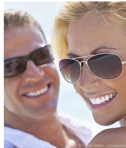
Veneers: Attraktives Lächeln mit perfekt schönen Zähnen

Veneers sind hauchdünne Schalen aus reiner Keramik oder speziellen Kunststoffen, die fest mit der Zahnoberfläche verbunden werden. Sie dienen dazu, verfärbte, abgebrochene oder schief stehende Zähne wieder ästhetisch perfekt herzustellen. Das Ergebnis lässt sich nicht mehr von natürlich schönen Zähnen unterscheiden. Nicht umsonst haben viele Stars und Prominente ihre Zähne mit Veneers verschönern lassen. Das ist jetzt auch für Sie möglich: Wenn Sie sich ein makellostes und strahlendes Lächeln wünschen, sind Veneers die beste Wahl!