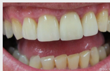
Veneers der oberen vier Schneidezähne 12 Jahre (!) nach dem Einsetzen. Es sind keinerlei Beläge vorhanden und das Zahnfleisch ist gesund.

Wenn Sie sich schon lange ein perfektes Lächeln wünschen, dann sprechen Sie uns an!