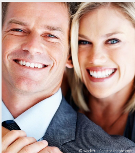
Selbstsicher mit gepflegten Zähnen

Dann werden Mund, Zähne und Zahnfleisch untersucht. Die Zahnbeläge werden angefärbt, um sie besser sichtbar zu machen und es wird die Tiefe der Zahnfleischtaschen gemessen.