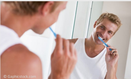
Trotz Zahnpflege bleiben Beläge

Auch wer seine Zähne regelmäßig und sorgfältig putzt, erreicht nicht alle Zahnoberflächen. Das sind vor allem die Stellen unter dem Zahnfleisch, in manchen Zahnzwischenräumen und die sehr feinen Grübchen auf den Kauflächen.