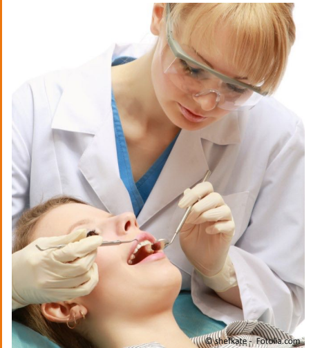
Gesunde Zähne in jedem Lebensalter mit regelmäßiger Professioneller Zahnreinigung (PZR) durch ausgebildete Fachkräfte

Lesen Sie hier, wie Sie Ihre Zähne und Ihr Zahnfleisch ein Leben lang gesund erhalten und Zahnfleischbluten und Mundgeruch vermeiden können!